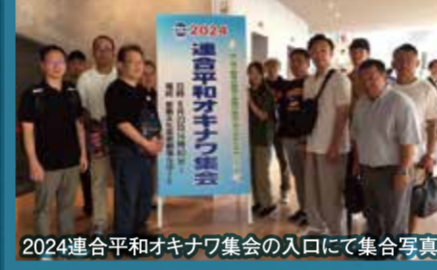
2024連合平和オキナワ集会の入口にて集合写真