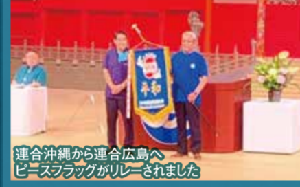
連合沖縄から連合広島へピースフラッグがリレーされました