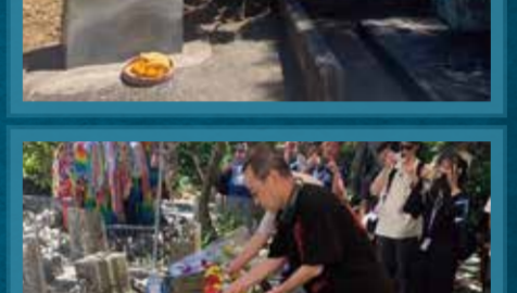
ひめゆり学徒隊を慰霊するひめゆりの塔にて献花