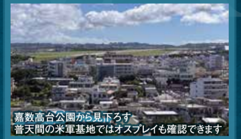
嘉数高台公園から見下ろす普天間の米軍基地ではオスプレイも確認できます

世界の恒久平和を願い、今後もこの平和行動を継続し、一人でも多くの方が戦争について深く考える機会として取組んでいきたいと思います。