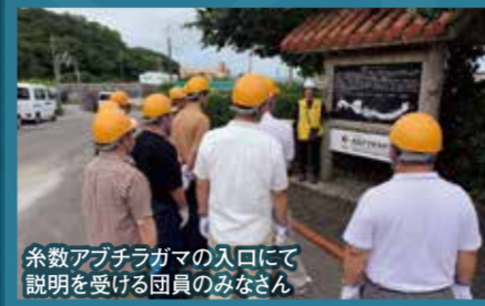
糸数アブチラガマの入口にて説明を受ける団員のみなさん