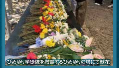
「沖縄戦終焉の地」糸数高台(普天間)を望む丘に作られた平和祈念公園にて集合写真