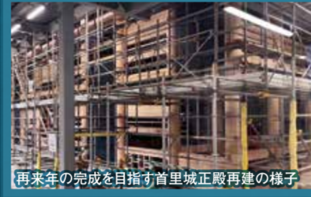
再来年の完成を目指す首里城正殿再建の様子