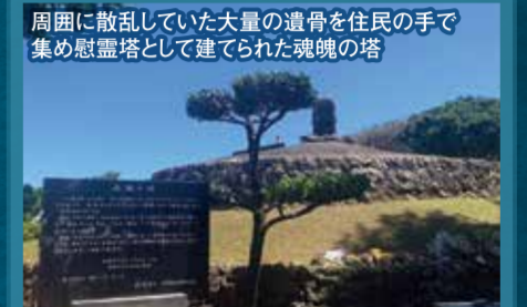
周囲に散乱していた大量の遺骨を住民の手で集め慰霊塔として建てられた魂魄の塔